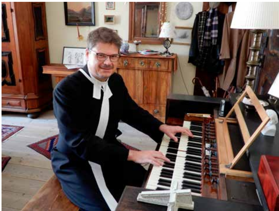
Aan het Bruckner-harmonium.

Het interview vindt plaats op zijn kamer, gelegen aan het einde van een lange kloostergang. Als ik op de afgesproken tijd arriveer, staat de deur al uitnodigend open. Van binnen ziet het vertrek er niet uit als dat van een kloosterling (sober) maar van iemand die midden in het leven staat, musicceert, studeert en oog heeft voor kunst en natuur. Er staat een groot tweeklaviers pedaalharmonium dat duidelijk in gebruik is. "Dit is het harmonium van Anton Bruckner dat bij hem thuis stond. Na zijn overlijden is het naar zijn arts gegaan. Diens nabestaanden hebben het aan het klooster geschonken, waar het lange tijd in de Bruckner-zimmer heeft gestaan. Het heeft ook als interim-orgel in Enns (bij Linz)