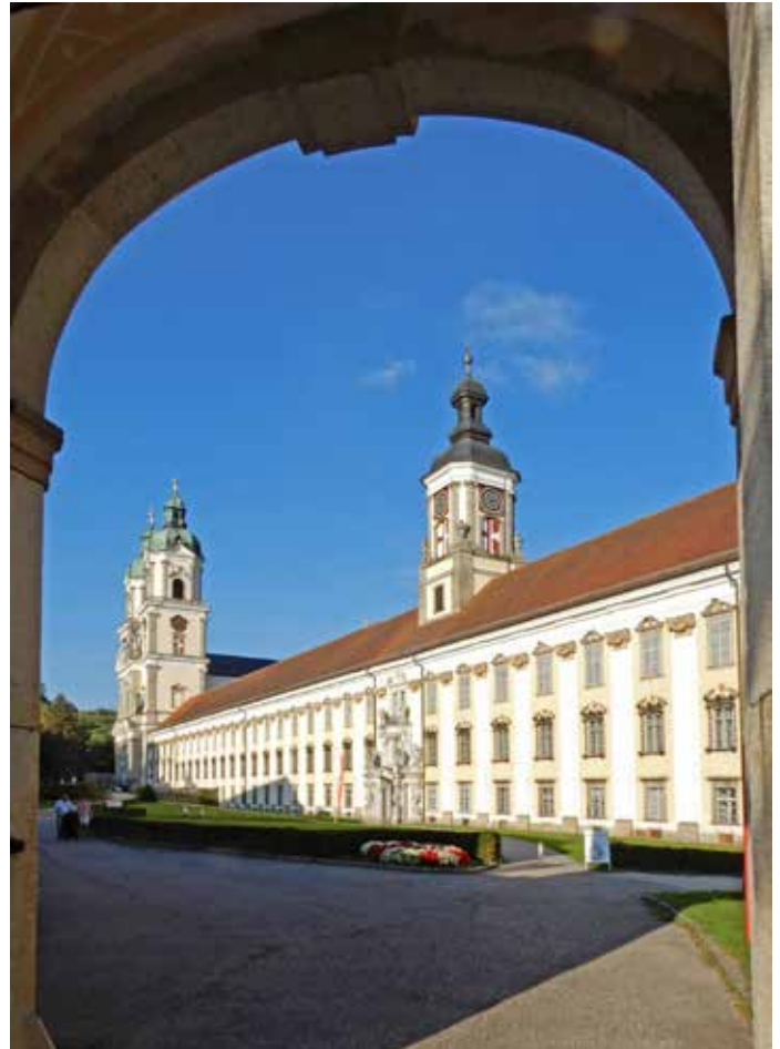
Het Chorherrenstift St. Florian.

De verschijning in 2012 van de omvangrijke Bruckner-biografie van Cornelis van Zwol (besproken in De Orgelvriend van oktober 2012) bracht een opleving van mijn interesse in Bruckner en zijn muziek teweeg. De wens ontstond om de omgeving te verkennen waar Bruckners composities zijn ontstaan. Een verlangen dat door de bekende muziekcriticus