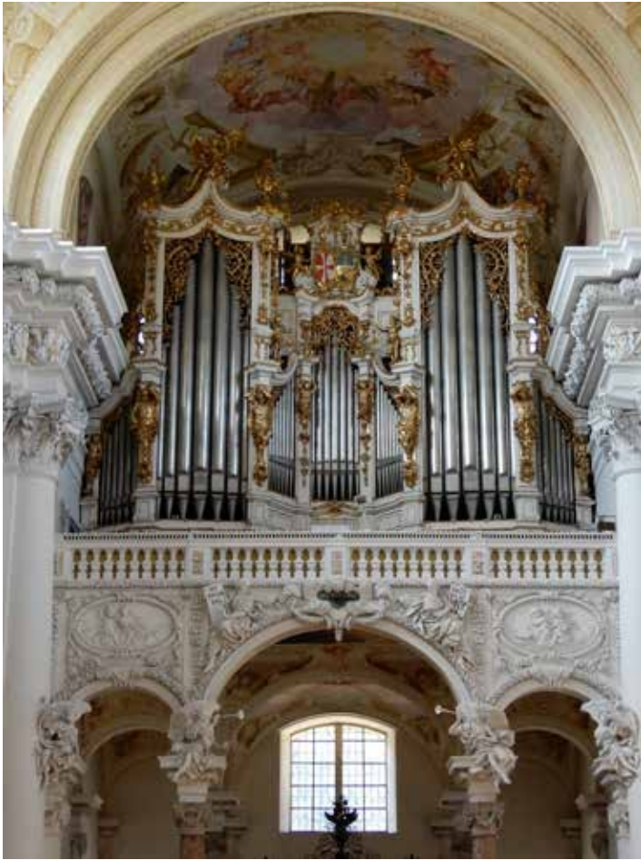
Het Brucknerorgel in de Stiftskirche.