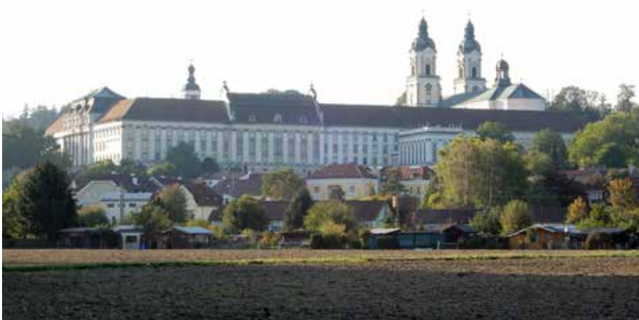
Het Stift St. Florian bij het vallen van de avond.